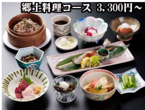
郷土料理コース 3,300円~